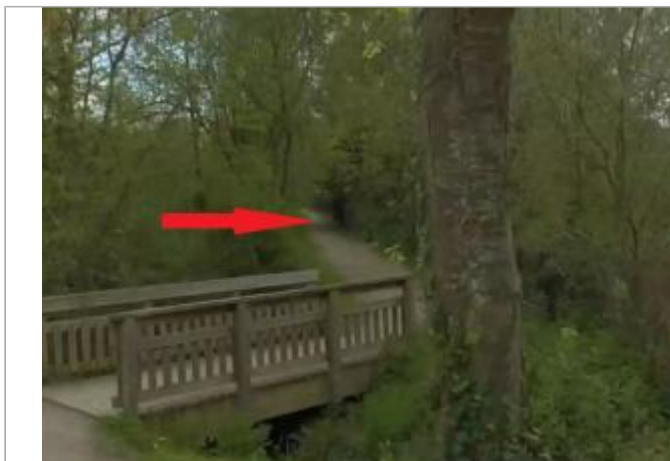
Sur le coté de l'allée Mère Térésa