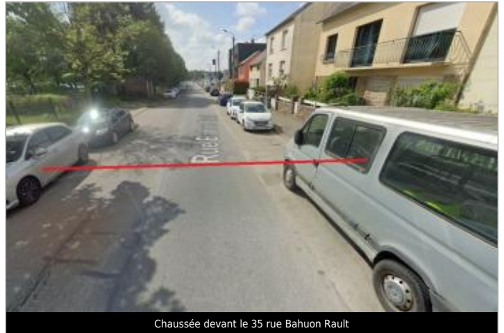
Chaussée devant le 35 rue Bahuon Rault

Coordonnées WGS84 : X: -1.68484463 / Y: 48.13537480