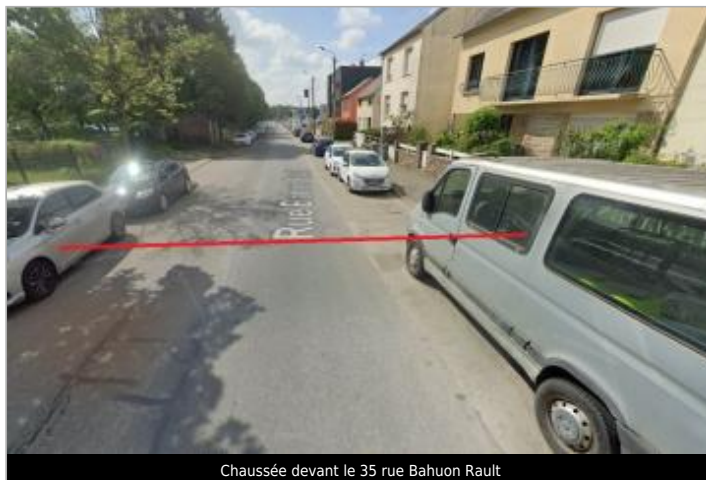
Chaussée devant le 35 rue Bahuon Rault