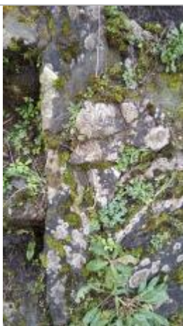
2025_Photo du repère

Altitude calculée de l'eau (en m) : 7.36 m