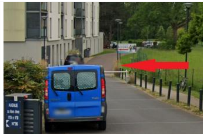
Parking de la résidence senior "Les prairies de l'Ille"