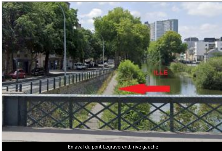
En aval du pont Legraverend, rive gauche

Coordonnées WGS84 : X: -1.68578870 / Y: 48.11765330