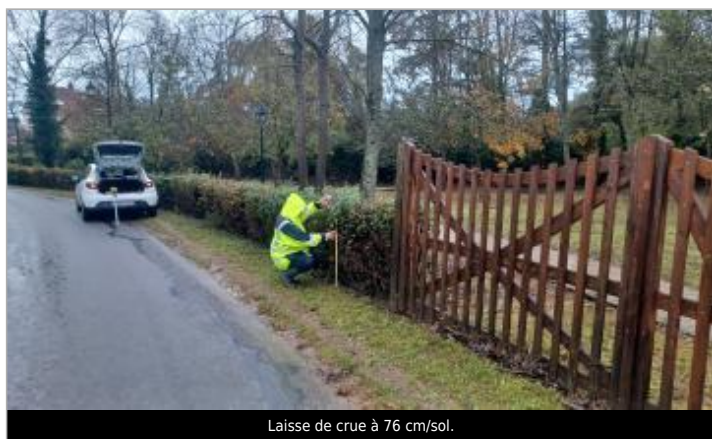
Laisse de crue à 76 cm/sol.

Organisme(s) : SPC Seine aval - Côtiers normands