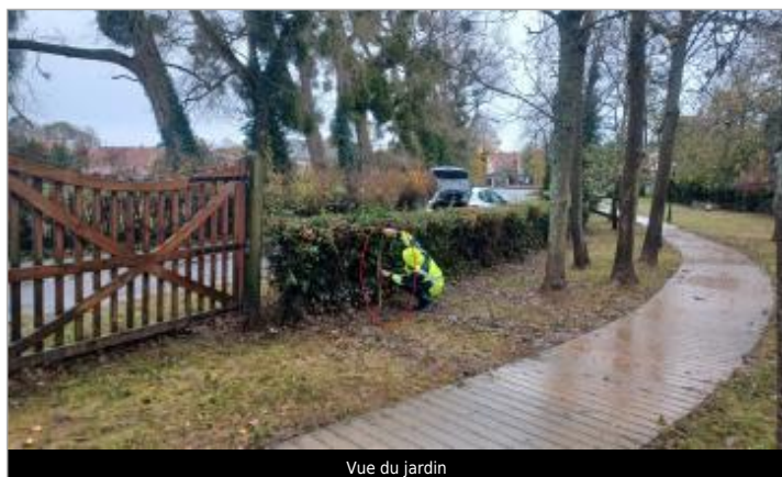
Vue du jardin