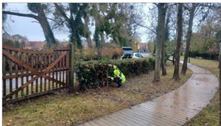
Vue du jardin