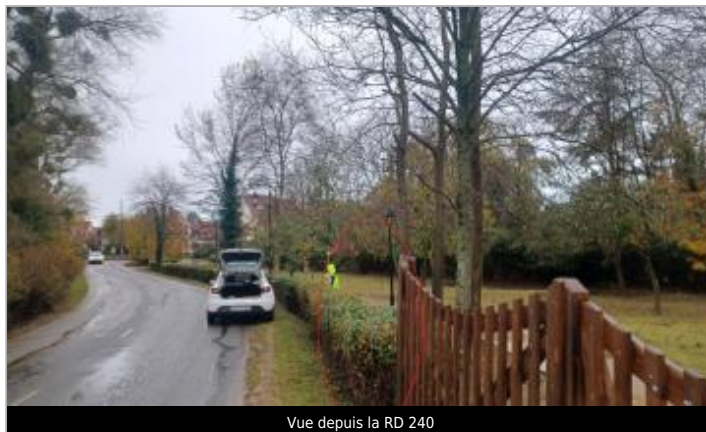
Vue depuis la RD 240