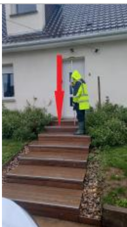
L'eau a atteint la 6 ème marche en partant du bas

Altitude calculée de l'eau (en m) : 13.04 m