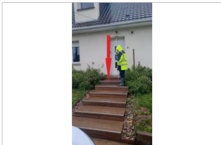
L'eau a atteint la 6 ème marche en partant du bas

Altitude calculée de l'eau (en m) : 13.04 m