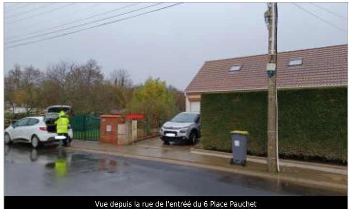
Vue depuis la rue de l'entrée du 6 Place Pauchet

Coordonnées WGS84 : X: 1.67673743 / Y: 50.65546650