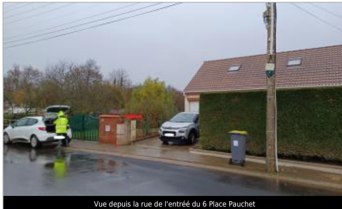
Vue depuis la rue de l'entrée du 6 Place Pauchet