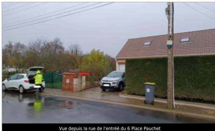
Vue depuis la rue de l'entrée du 6 Place Pauchet