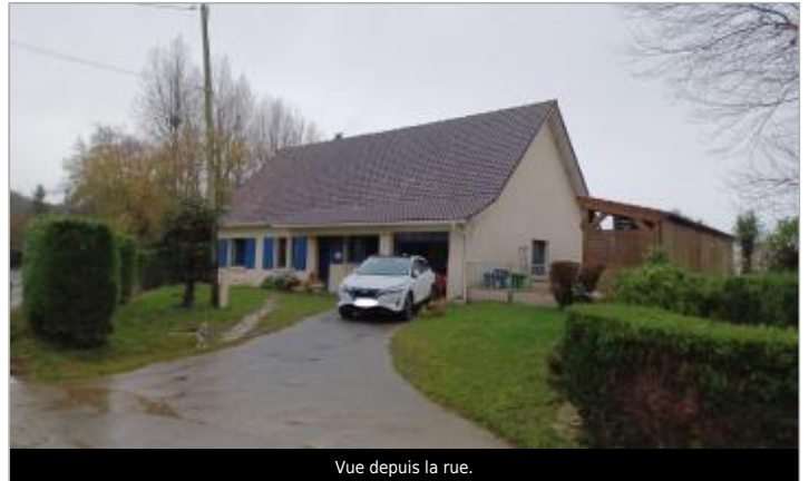
Vue depuis la rue.

Coordonnées WGS84 : X: 1.67599158 / Y: 50.65496390