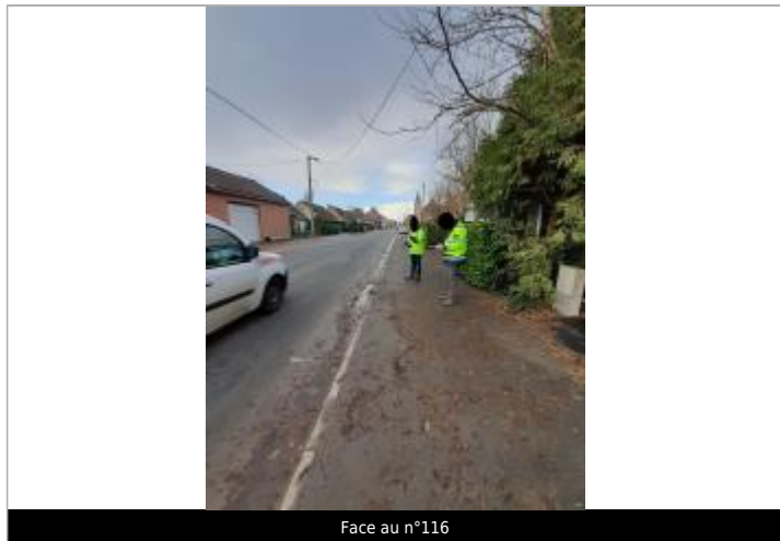
Face au n°116