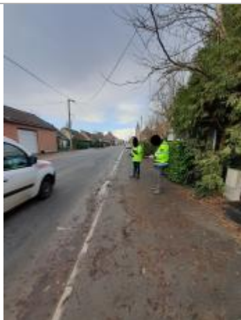
Face au n°116

Altitude calculée de l'eau (en m) : 17.77 m