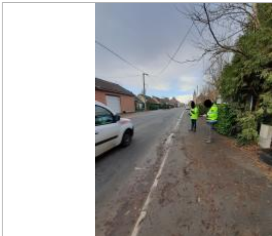
Face au n°116

Altitude calculée de l'eau (en m) : 17.77