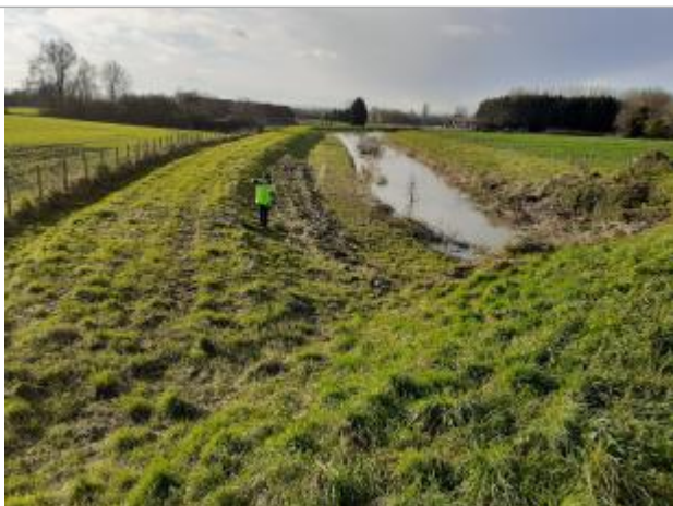
Laisse RG en haut des enrochements

Altitude calculée de l'eau (en m) : 20.73 m