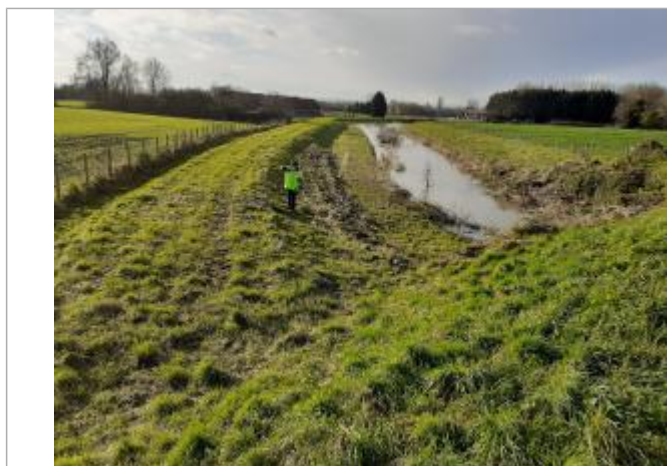
Laisse RG en haut des enrochements

Code : WEB_R_202311283818 Date de mise à jour : 28/11/2023 Auteur : SPC BN