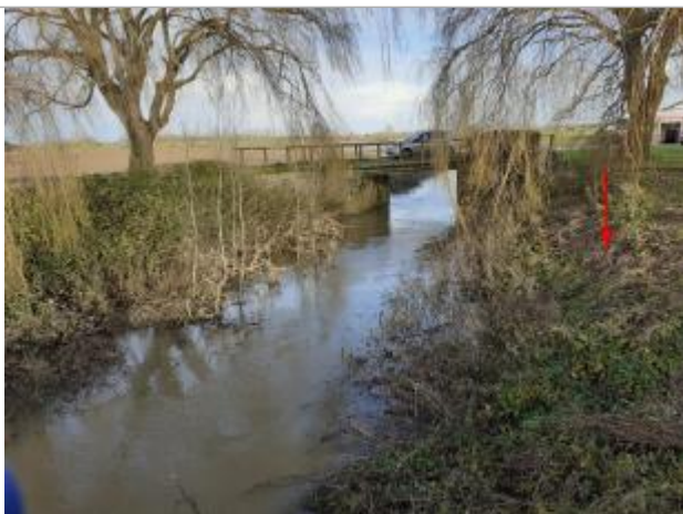
Amont du pont

Altitude calculée de l'eau (en m) : 21.8