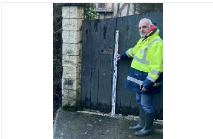
laisse de crue sur le portail, repere sous la boite à lettre