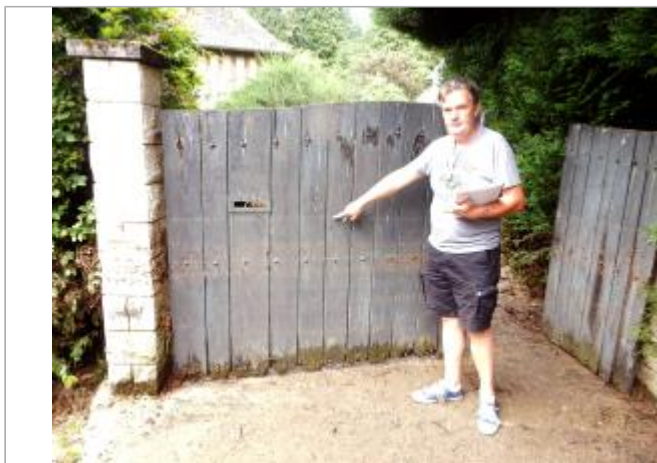
Portail en bois d'une maison