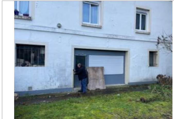
mur d'immeuble au droit de la porte

Coordonnées WGS84 : X: 0.21294587 / Y: 49.14045350