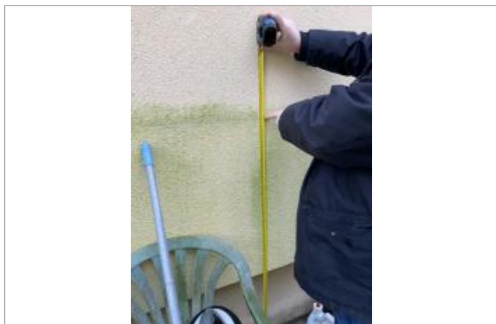
niveau de crue associé aux traces d'humidité visibles sur le mur. 65 cm d'eau dans l'habitation