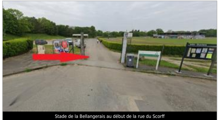
Stade de la Bellangerais au début de la rue du Scorff