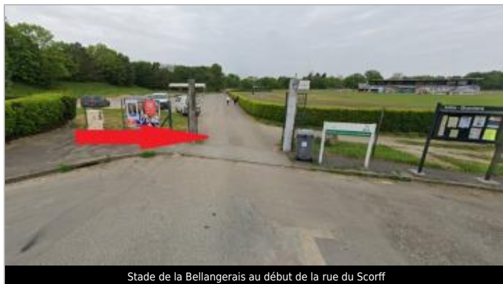
Stade de la Bellangerais au début de la rue du Scorff