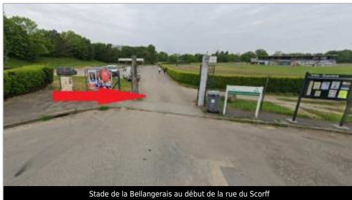
Stade de la Bellangerais au début de la rue du Scorff