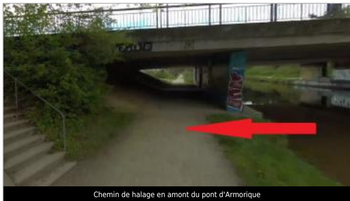
Chemin de halage en amont du pont d'Armorique