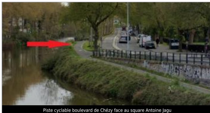
Piste cyclable boulevard de Chézy face au square Antoine Jagu