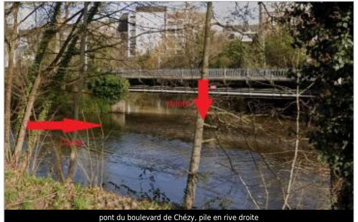
pont du boulevard de Chézy, pile en rive droite