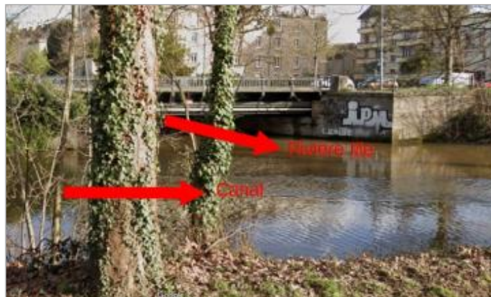
Pont boulevard de Chézy sur l'Ille à la confluence avec le canal d'Ille et Rance