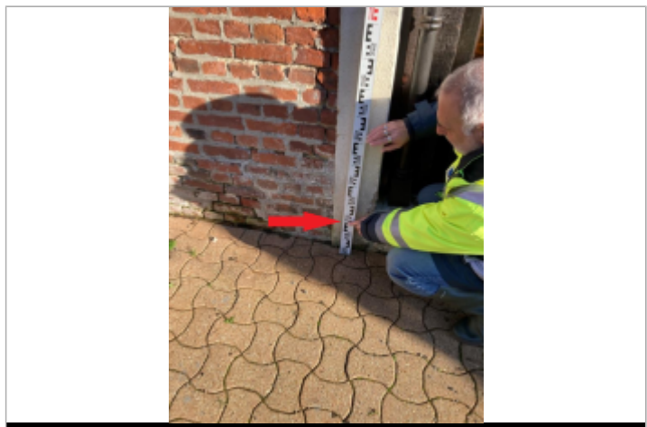
Niveau façade Ouest

MARQUE Maximum de l'inondation : Oui Visibilité : Oui État du repère : Disparu Pérennité : Aucune Repère calculé : Non PHEC : Oui