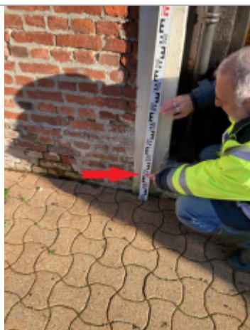
Niveau façade Ouest