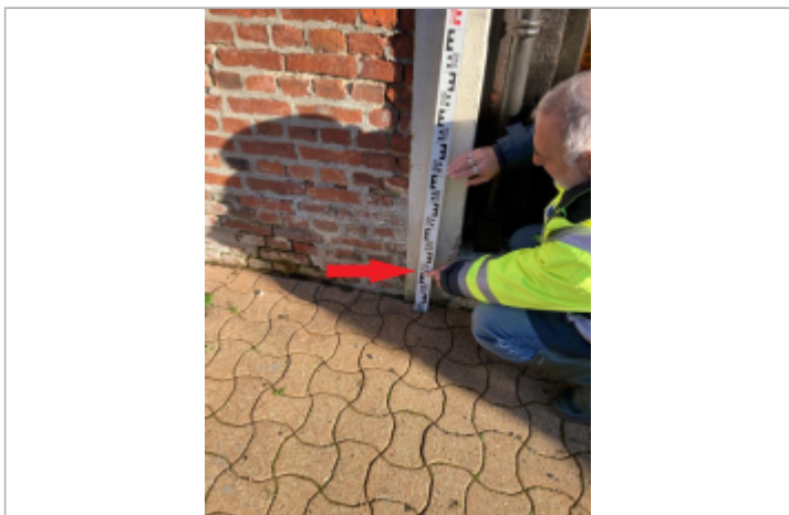
Niveau façade Ouest

MARQUE Maximum de l'inondation : Oui Visibilité : Oui État du repère : Disparu Pérennité : Aucune Repère calculé : Non PHEC : Oui