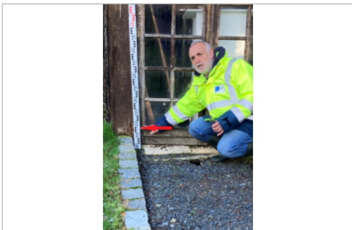
Vitre de la remise