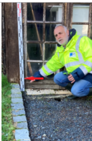
Vitre de la remise

Altitude calculée de l'eau (en m) : 67.83