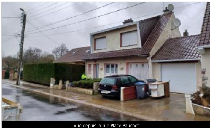
Vue depuis la rue Place Pauchet.

Coordonnées WGS84 : X: 1.67635177 / Y: 50.65520910