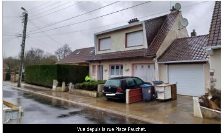
Vue depuis la rue Place Pauchet.