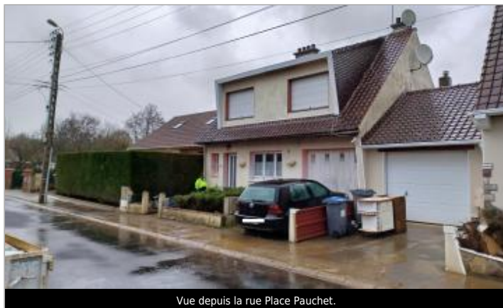
Vue depuis la rue Place Pauchet.