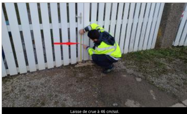
Laisse de crue à 46 cm/sol.