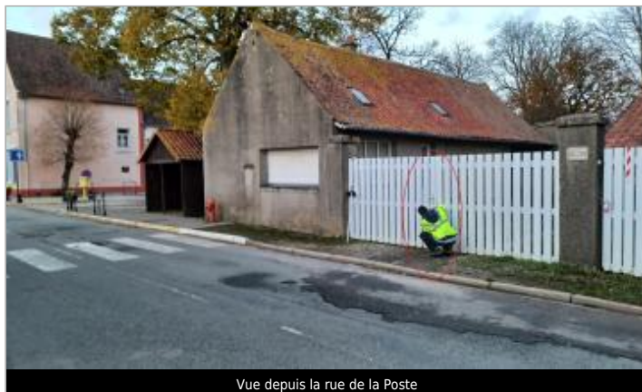
Vue depuis la rue de la Poste

Coordonnées WGS84 : X: 1.67457604 / Y: 50.65762410