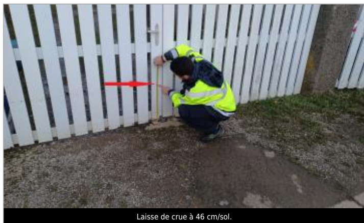
Laisse de crue à 46 cm/sol.

Altitude calculée de l'eau (en m) : 12.35