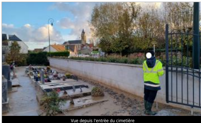
Vue depuis l'entrée du cimetière