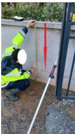
Laisse de crue à 89 cm/haut du muret.

Altitude calculée de l'eau (en m) : 15.24 m