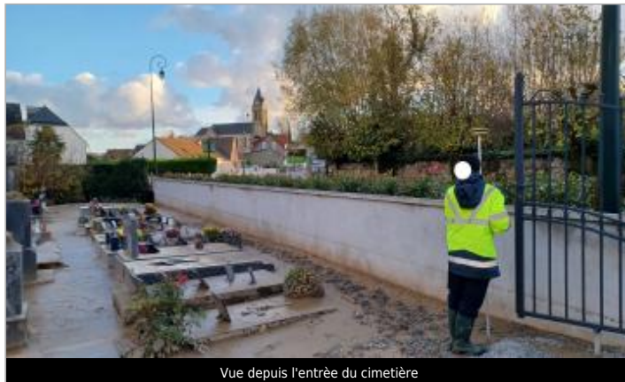
Vue depuis l'entrée du cimetière