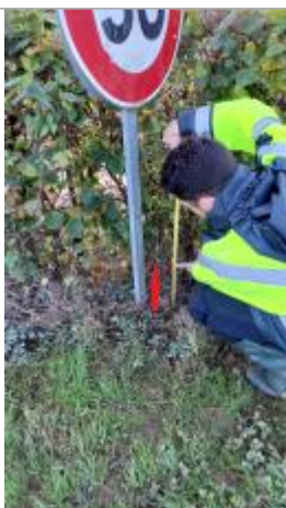
Laisse de crue à 30 cm/sol

Altitude calculée de l'eau (en m) : 15.59 m