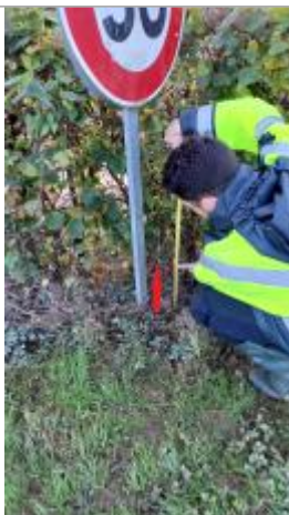
Laisse de crue à 30 cm/sol

Altitude calculée de l'eau (en m) : 15.59 m