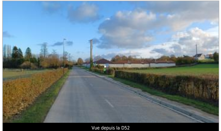
Vue depuis la D52