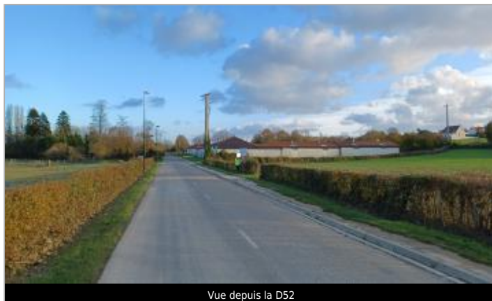
Vue depuis la D52