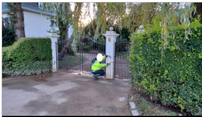
Laisse de crue à 77 cm/sol

Organisme : SPC Seine aval - Côtiers normands