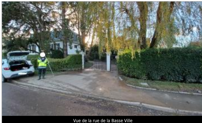
Vue de la rue de la Basse Ville

Coordonnées WGS84 : X: 1.70145855 / Y: 50.65421050