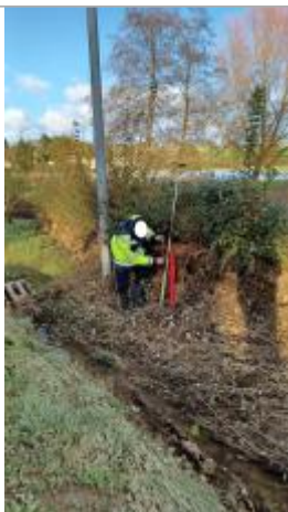
Laisse de crue à 96 cm/sol

Altitude calculée de l'eau (en m) : 14.86