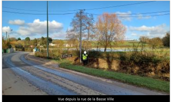
Vue depuis la rue de la Basse Ville

Coordonnées WGS84 : X: 1.70139895 / Y: 50.65486620