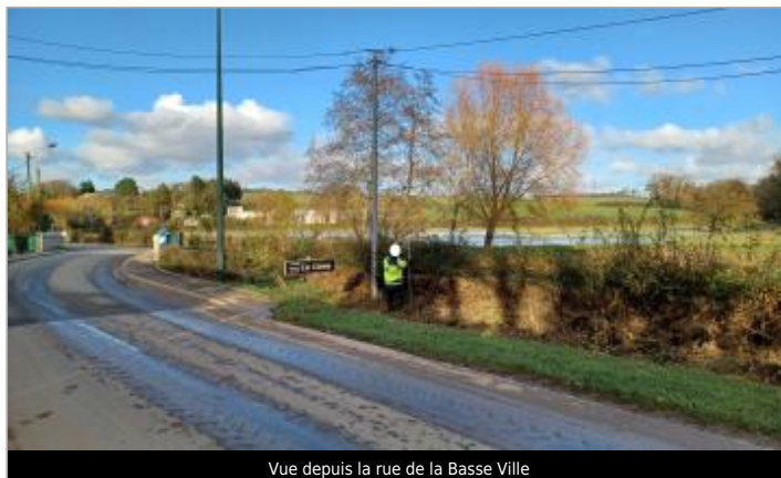
Vue depuis la rue de la Basse Ville