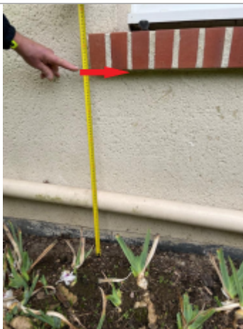
Marque sous l'appui de fenêtre

Altitude calculée de l'eau (en m) : 67.7 m