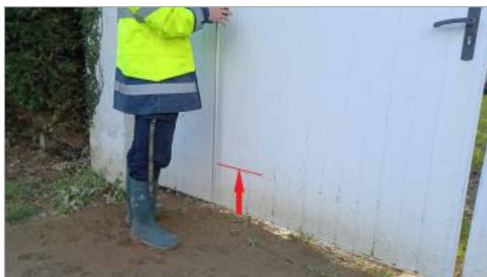
Laisse de crue à 28 cm/sol