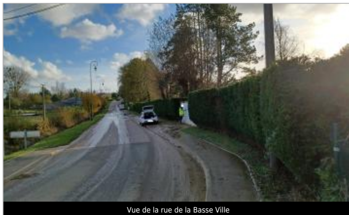
Vue de la rue de la Basse Ville