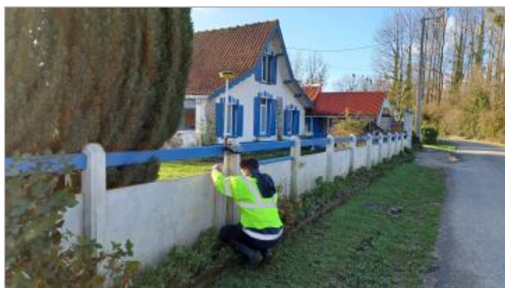
Laisse de crue sur le muret