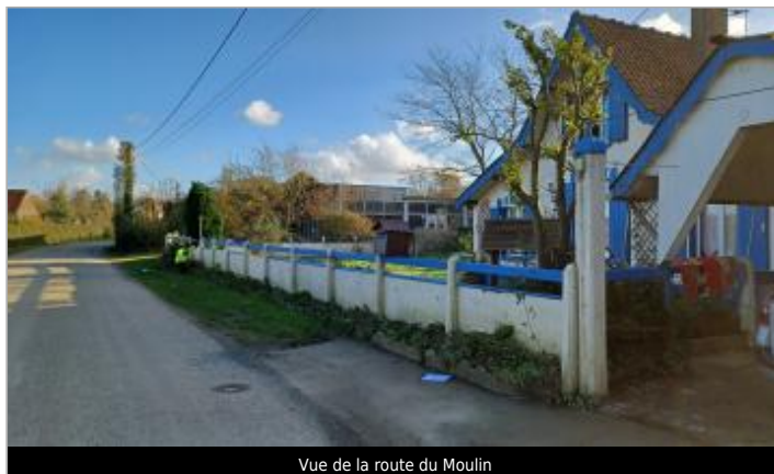
Vue de la route du Moulin