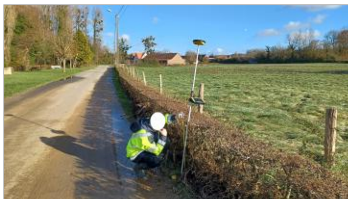
Laisse de crue à 56 cm/sol