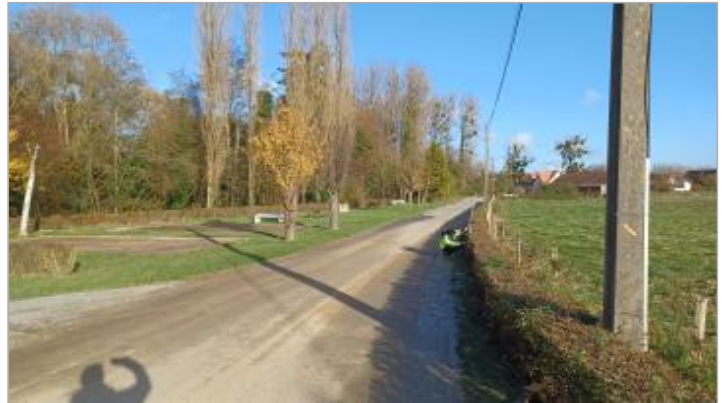
Vue depuis la route du Moulin

Coordonnées WGS84 : X: 1.75167536 / Y: 50.66353110