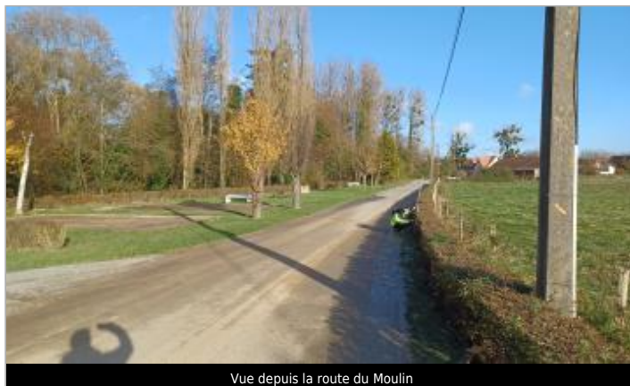
Vue depuis la route du Moulin