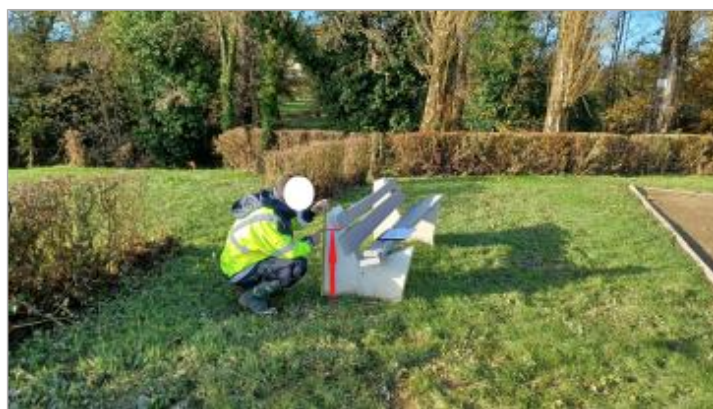
Laisse de crue à 56 cm/sol