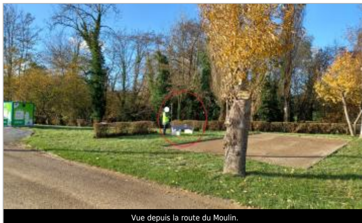
Vue depuis la route du Moulin.