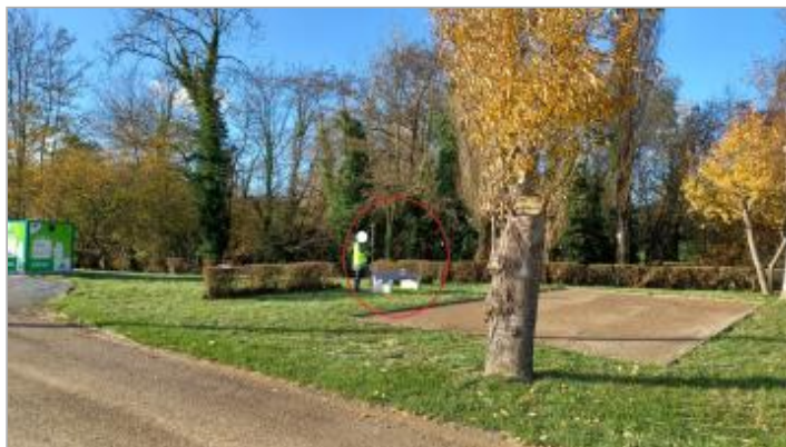
Vue depuis la route du Moulin.