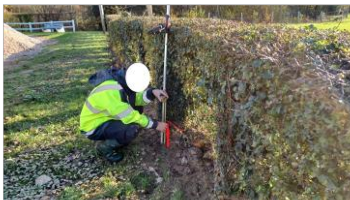
Laisse de crue à 27 cm/sol