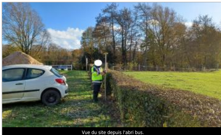
Vue du site depuis l'abri bus.