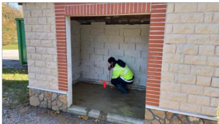
Laisse de crue à l'intérieur de l'abri bus.

Altitude calculée de l'eau (en m) : 22.175 m