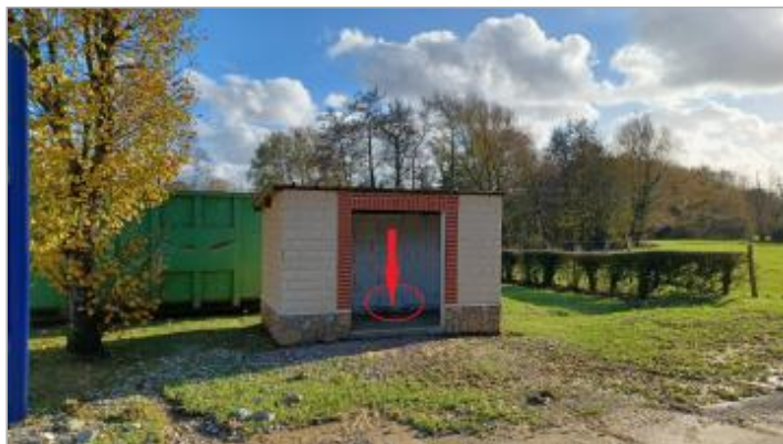
Vue de l'abri bus depuis la route de l'Eglise

Coordonnées WGS84 : X: 1.75034732 / Y: 50.66371560