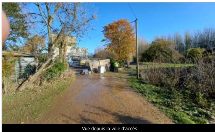
Vue depuis la voie d'accès