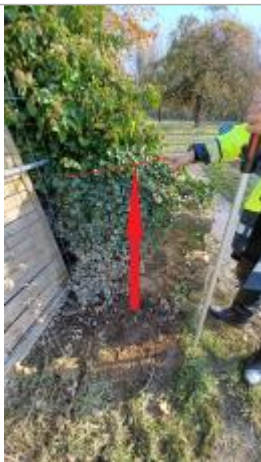
Laisse de crue à 94 Cm/sol

Altitude calculée de l'eau (en m) : 26.86 m