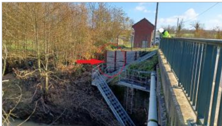
Vue depuis le pont de la RD 341.