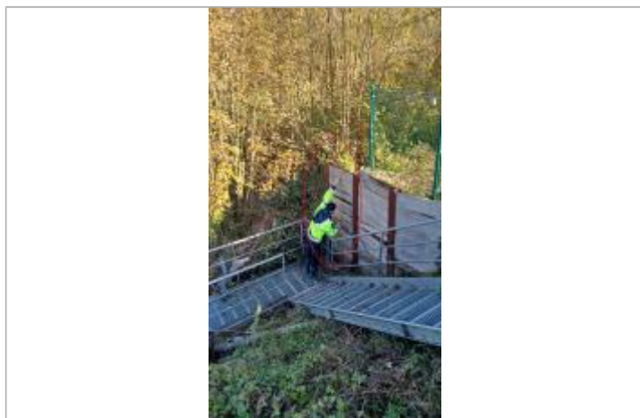
Vue du repère depuis le pont.