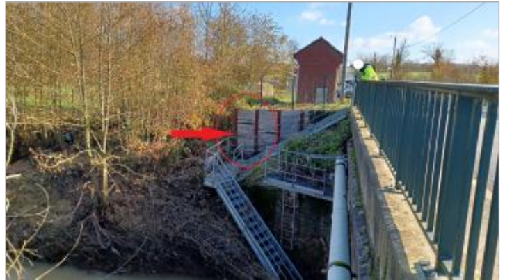
Vue depuis le pont de la RD 341.

Coordonnées WGS84 : X: 1.76768421 / Y: 50.68119500