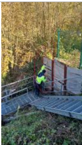
Vue du repère depuis le pont.