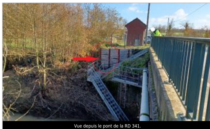
Vue depuis le pont de la RD 341.

GÉOLOCALISATION Coordonnées WGS84 : X: 1.76768421 / Y: 50.68119500 Coordonnées RGF93 (Lambert 93) X: 612753.39 / Y: 7065609.9 Coordonnées RGF93 (ETRS89) : X: 1.7676842 / Y: 50.681195 Code Hydro: E53-0020 Rive de référence: Gauche