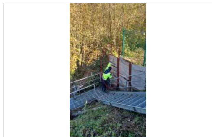
Vue du repère depuis le pont.

GÉNÉRAL Code : WEB_R_202311205206 Date de mise à jour : 20/11/2023 Auteur : SACN_FD