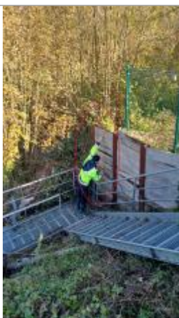
Vue du repère depuis le pont.

Altitude calculée de l'eau (en m) : 26.445